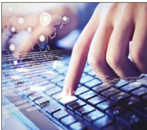
COMPUTACIÓN E INFORMÁTICA